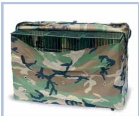
Art. 508 - ZAINO PER 6 GABBIE GRANDI (cm. 77 x 33 x h. 52)