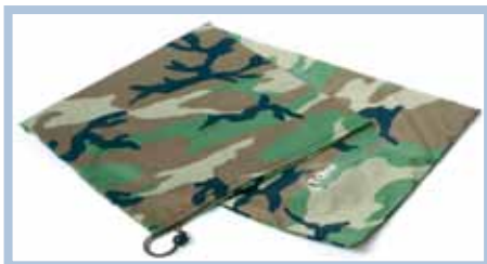
Art. 502 - CUSTODIA PER TELO E TELAIO ZAINO