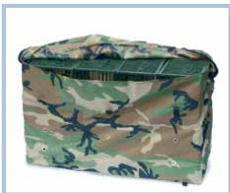
Art. 506 - ZAINO PER 8 GABBIE PICCOLE (cm. 69 x 25 x h. 45)